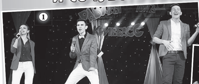
1 16 апреля в ДК «Центральный» ООО «Социальные инициативы Криворожья» состоялась заключительная игра Рабочей лиги КВН Кривбасса, которая уже 14-й сезон проходит под эгидой профсоюза металлургов и горняков Украины.