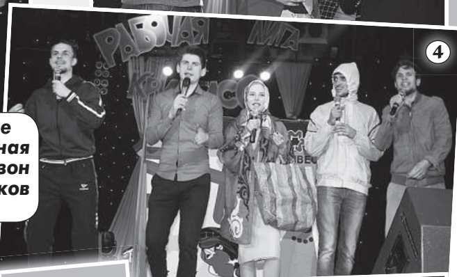
Финал Рабочей лиги КВН