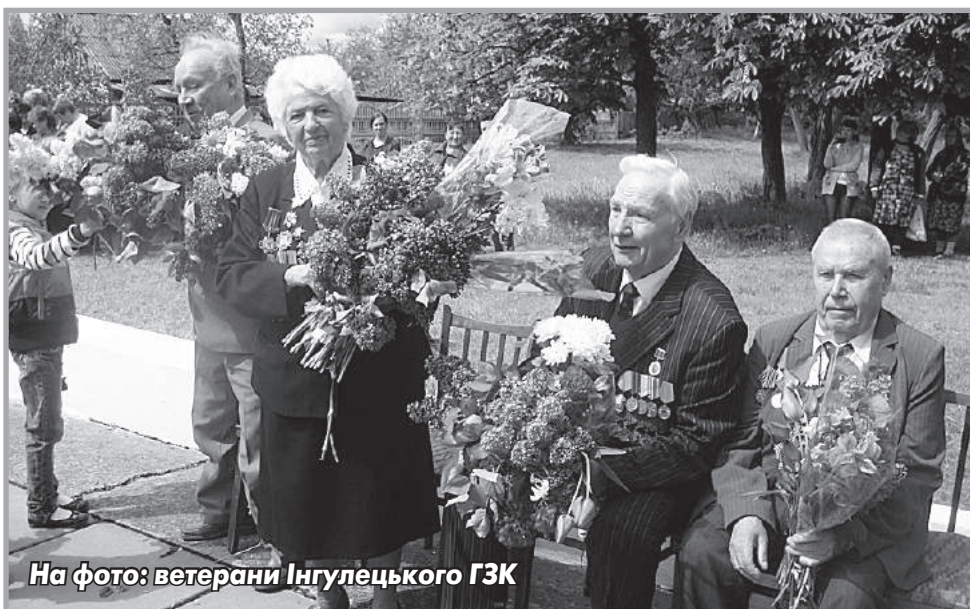
На фото: ветерани Інгuleцького ГЗК

ЖИВІТЬ У МИРІ І ТРУДІ, З ЛЮБОВ'Ю В СЕРЦІ, З ВОГНИКОМ В ДУШІ!