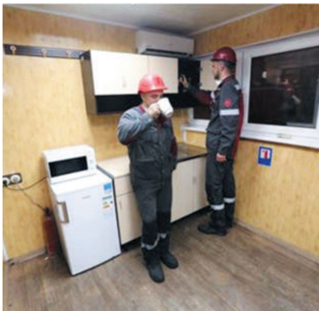
Первичная организация ПМГУ СевГОКа, Facebook.