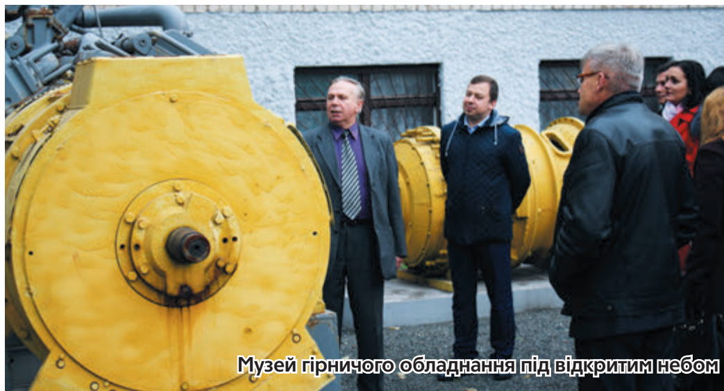
Музей гірничого обладнання під відкритим небом