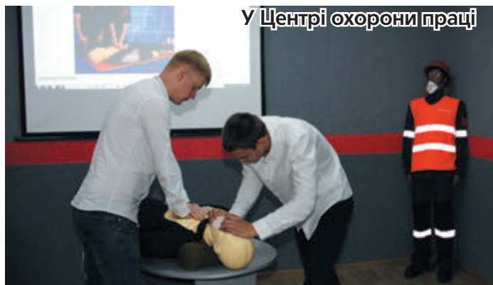
У Центрі охорони праці

«Фантастика! Мрія! Молодці!» – тільки й чулося від представників делегації.