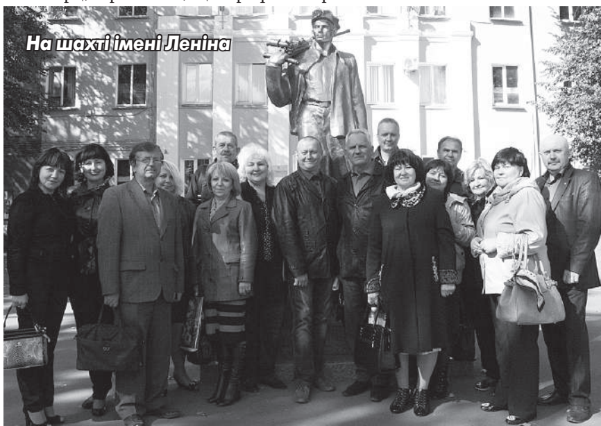
На шахті імені Леніна