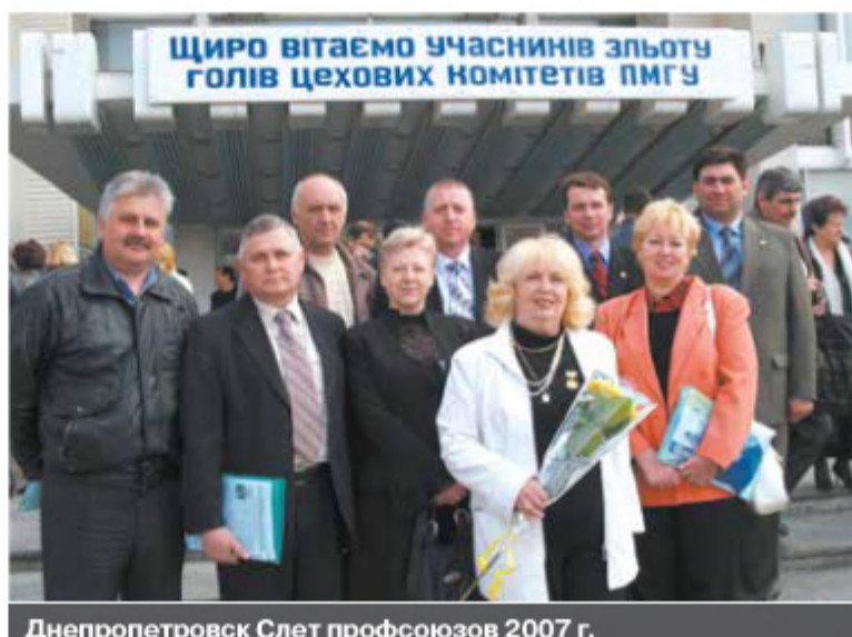
Днепропетровск Слет профсоюзов 2007 г.

По мотивам книги Первичной организации ПМГУ ПАО «СЕВГОК» «Вехи истории»