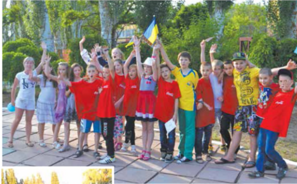
Детское оздоровление - 2,2 млн.грн.