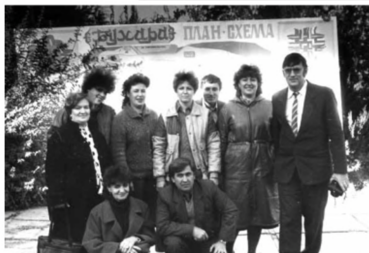
Поездка лучших предцехкомов в Узбекскую ССР 1989 г.

На заседании завкома 15 мая 1970 года принято решение о начале строительства базы отдыха в селе Петрово. При активном участии профсоюзных активистов в 1971 году проведен смотр-конкурс по повышению культуры быта и эстетики предприятия. Наведен порядок в це-