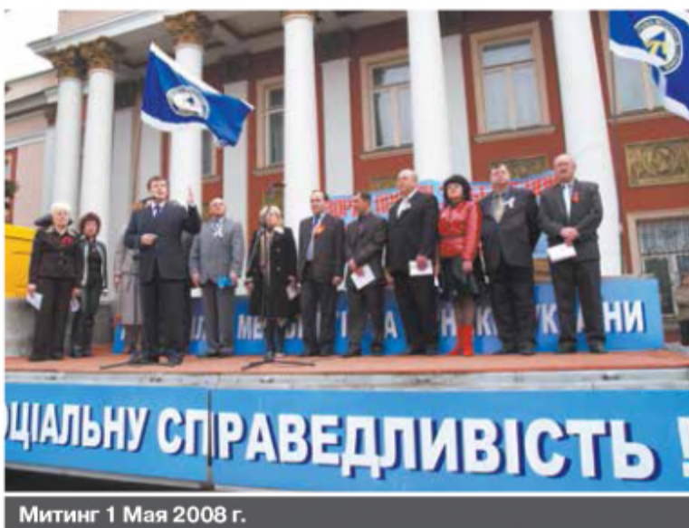
Митинг 1 Мая 2008 г.

Самыми запоминающимися в жизни профкома комбината стали 90-е годы. Пока государство найдет реальный выход из кри-