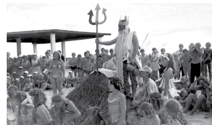
1980 г. День Нептуна