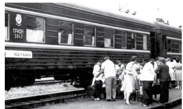
Нас ждет солнечный «Приморский» - родители провозжат детей в оздоровительный лагерь