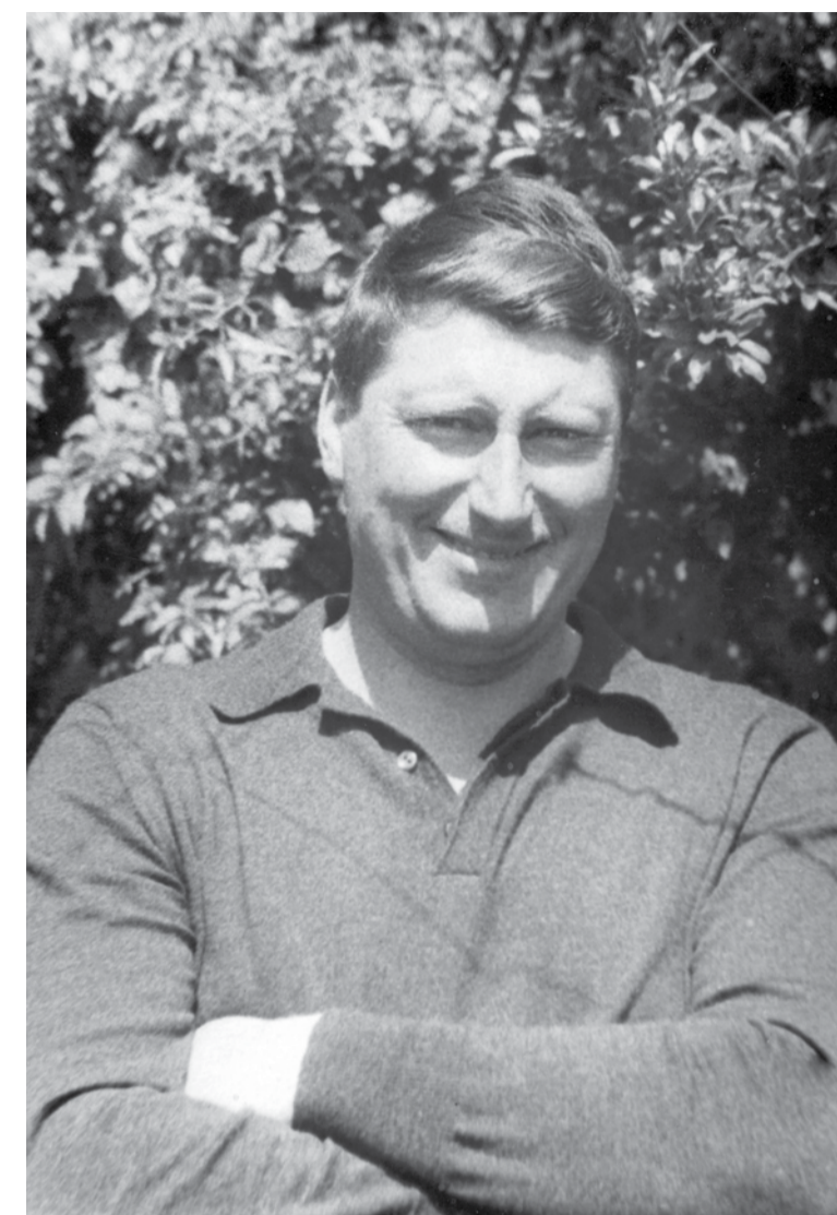
Николай Панчошный, (годы жизни 24 октября 1936 – 29 мая 2017)